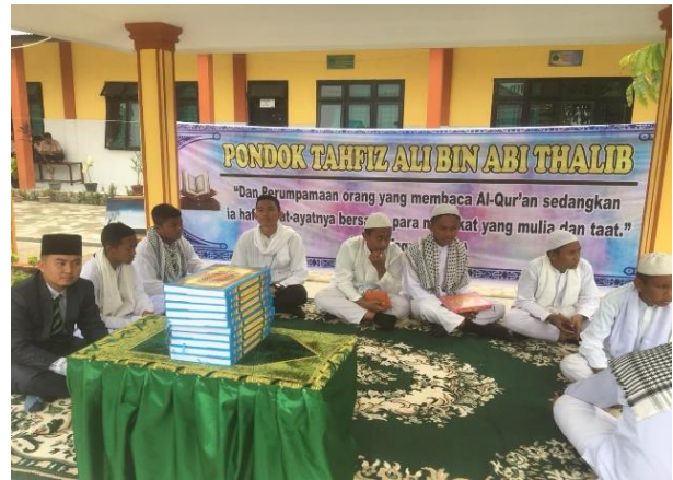
Gambar 3. Penguatan spritual di pondok tahfiz Qur'an MAN 2 Deli Serdang

Kegiatan tahfiz Qur'an yang dilksaksanakan di pondok-pondok kecil yang terdapat di lingkungan sekolah, juga kerap di isi oleh guru-guru dengan penyampaian kajian keislaman yang dikutip dari potongan-potongan ayat yang sedang dihapal oleh siswa. Berikut dokumentasinya: